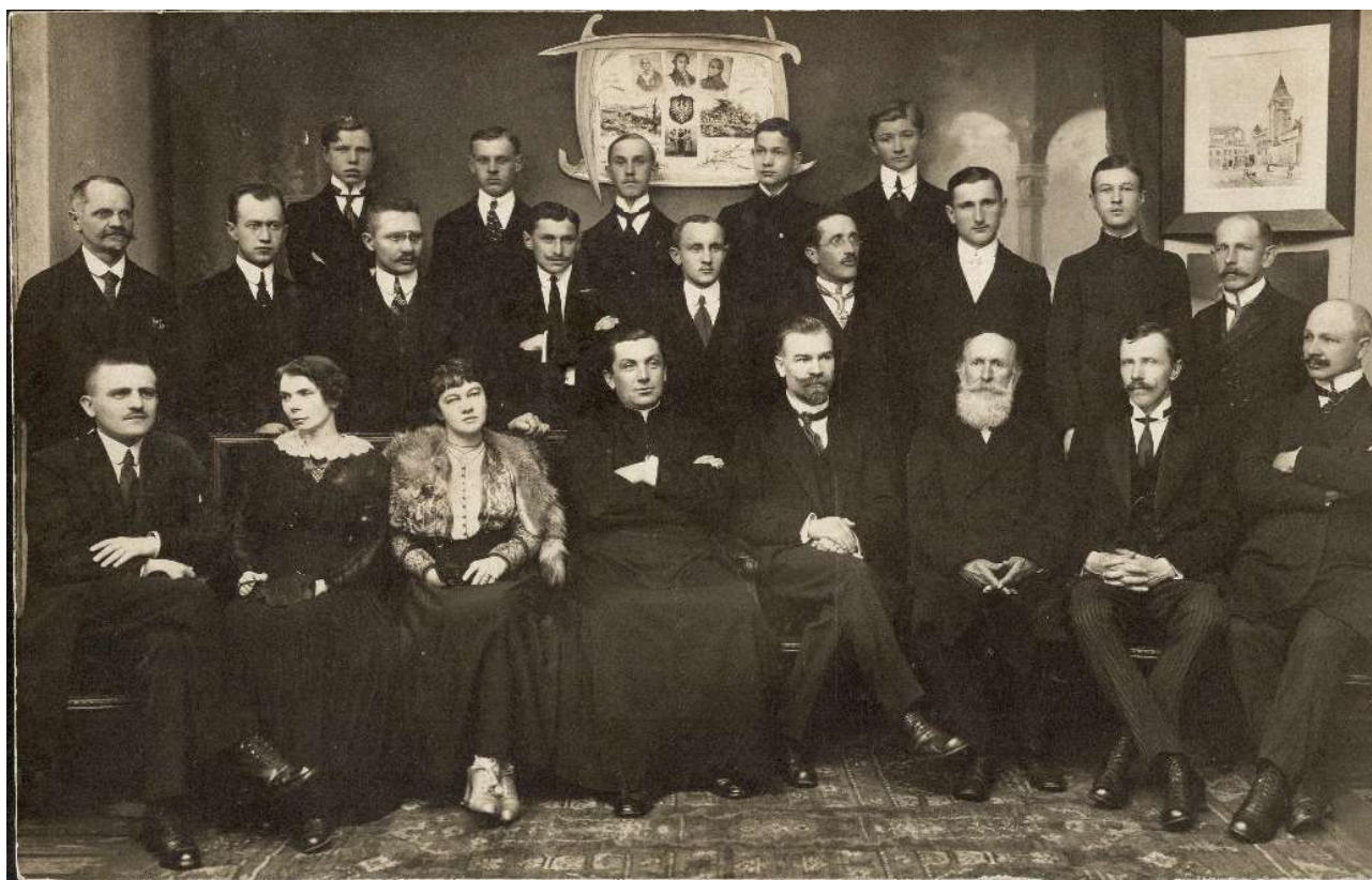
Matura – ostatni rocznik szkoły handlowej, 1916 r. Zbiory I LO im. Tadeusza Kościuszki w Łomży