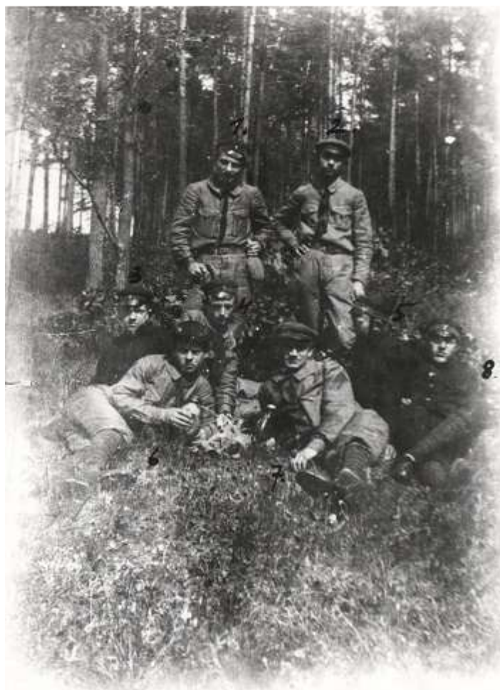
Harcerze I Drużyny Harcerskiej im. Tadeusza Kościuszki w Łomży, 1916 r.